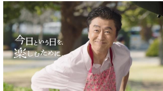
新テレビCM「娘の挑戦」篇より