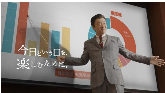
新テレビCM「プレゼン」篇より

CMの映像は、SOMPOホールディングスおよび損保ジャパンの公式ウェブサイトと公式YouTubeチャンネルでも公開し、4月15日（金）からご視聴いただけます。